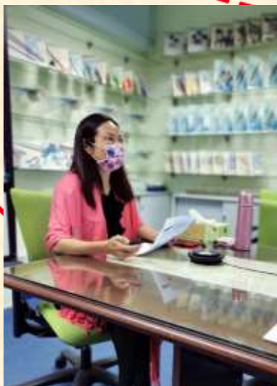
2021 年 5 月 29 日 舉辦網上自閉症兒童講座，目標是 國內自閉症兒童之父母、照顧者及 教師。當日有 10 人參加。於 7 月 10 日再重辦，有 24 人參加。