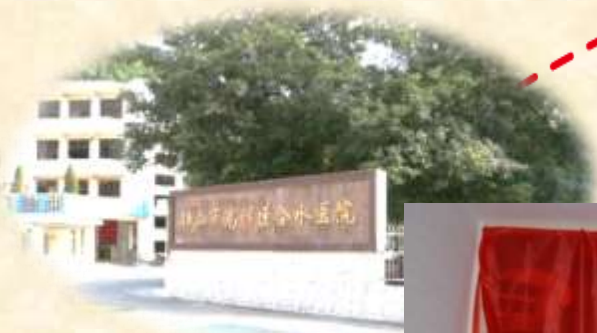
2016 年 接辦佛山市高明區合水醫院